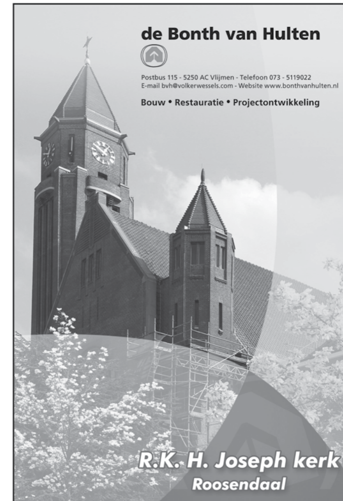
R.K. H. Joseph kerk Rosendaal

Bouw • Restauratie • Projectontwikkeling